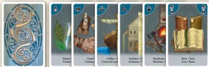
Verso alchimie, commerce, construction navale, architecture et métallographie & livres