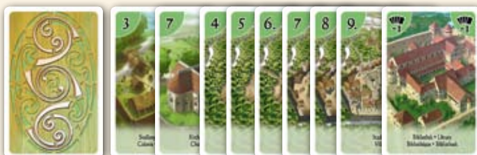
Verso cité, église, villes, bibliothèque