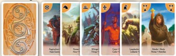
Verso des Anglo-Saxons, des Huns, des Vikings, des Goths, des Lombards, des moines