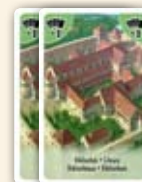
Tas des cartes « bibliothèques »