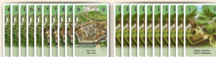
Tas des cartes « villes »

Le joueur le plus âgé commence. Les autres joueurs suivent dans le sens des aiguilles d'une montre.