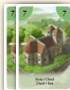
Tas des cartes « églises »