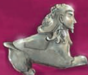
Esfinge Estatuilla con forma de esfinge procedente de Malia